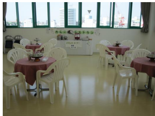
6階 カレーレストラン