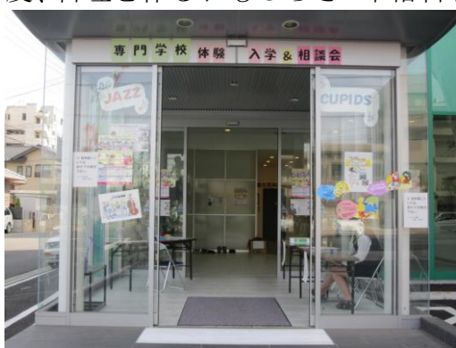
国際調理専修学校が会場に

自分の将来を見据えた、資格取得ができる専門学校！！国際調理専修学校では月に1回の体験入学も行っています☆第一回は5月28日(土)です！ぜひ一度、料理を作るおもしろさ・本格料理を食べる楽しさを味わってみませんか？