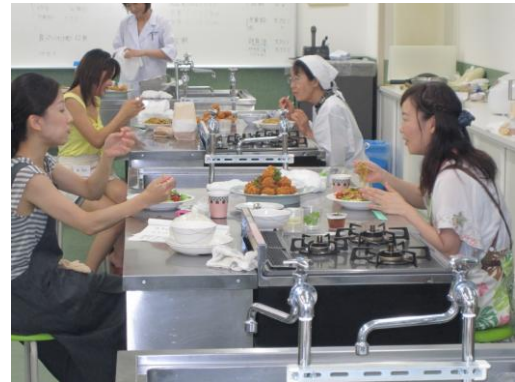
美味しい料理に会話も弾みますね♪