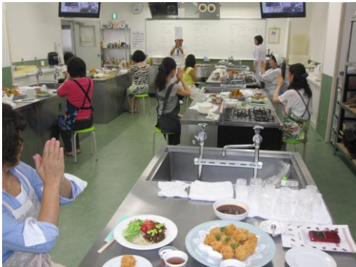
食べる前は、恒例の儀式を・・・ 手を合わせて「いただきます！！」