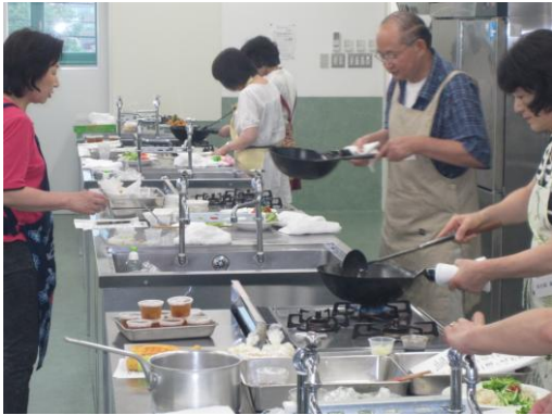
中華鍋は重いので、力が入ります！！